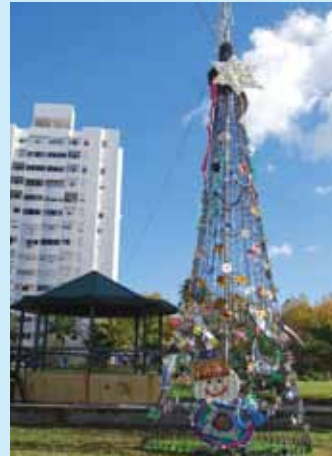
Bairro do Condado