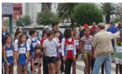
Clube Marvila Jovem festeja aniversário com Grande Prémio de Atletismo