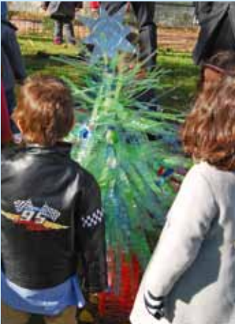
Bairro do Condado - Polidesportivo

Decorações realizadas pelos colaboradores e utentes de instituições várias da freguesia