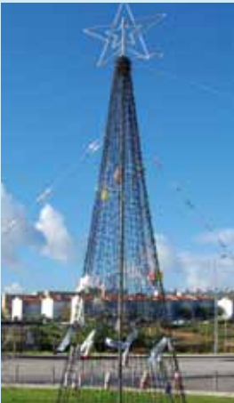
Rua Aquilino Ribeiro