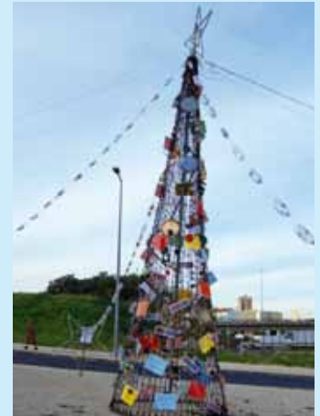
Bairro do Armador