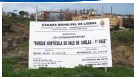
Vale de Chelas Maior parque hortícola urbano do mundo

Nesta edição: iniciativas "Marvila, a minha comunidade Natal"