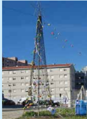
Bairro dos Alfinetes e Bairro das Salgadas