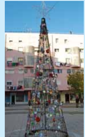
Bairro dos Lóios