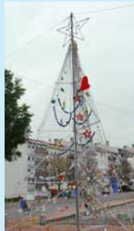
Bairro da Flamengo