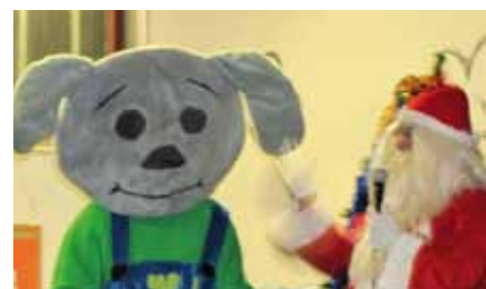
Pai Natal e Comilão foram às escolas