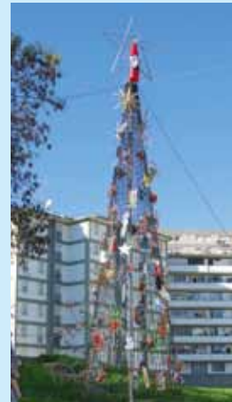
Rua Manuel Teixeira Gomes